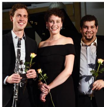
Trio tRialLog ©Ensemble tRialLog