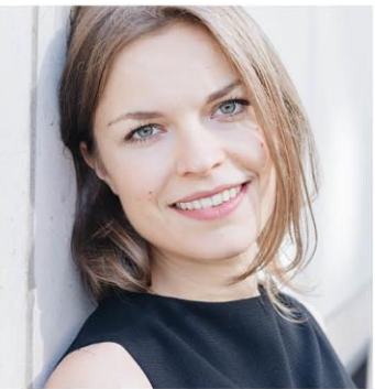
Theresa Pils © Álfrheiður Guðmundsdóttir