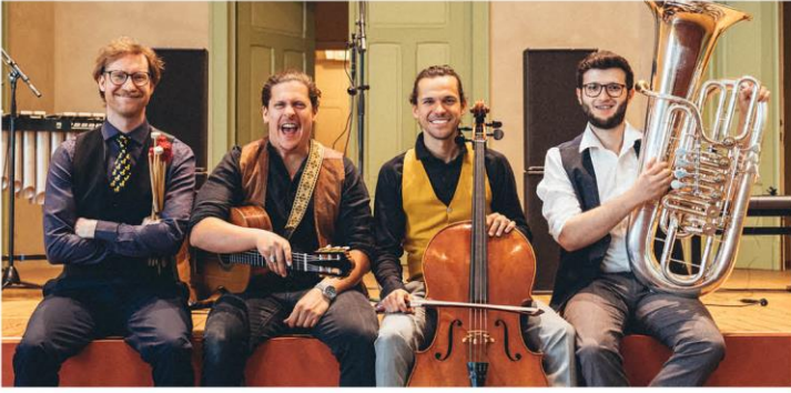
The Erklings