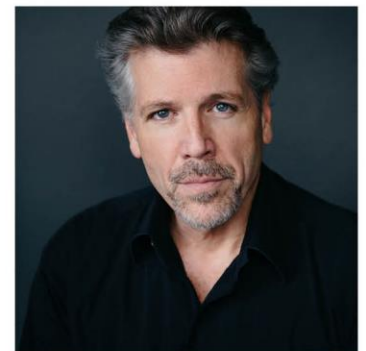
Thomas Hampson