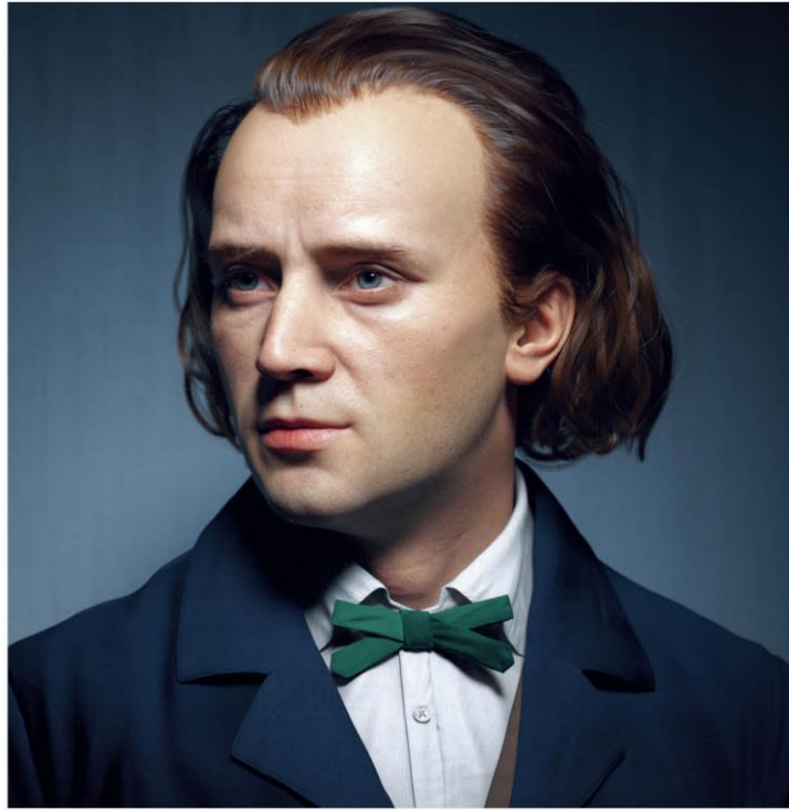
Johannes Brahms