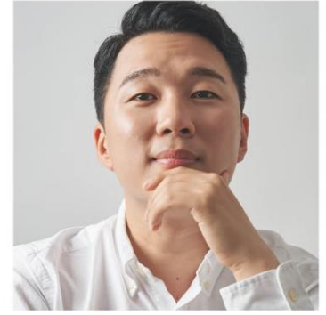
Tae Hwan Yun